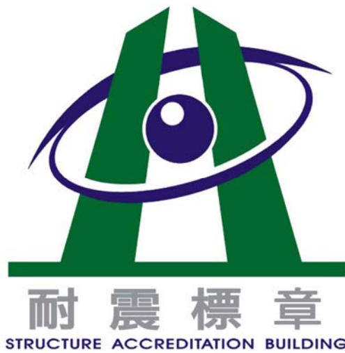
表 3 耐震標章申請案件統計表